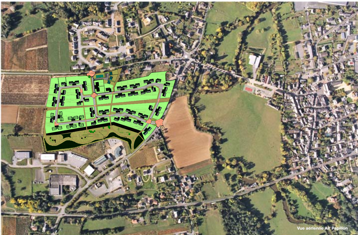
Vue aérienne Air Papillon