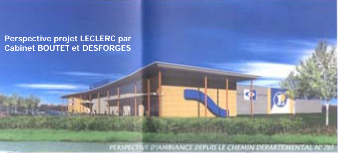
Perspective projet LECLERC par Cabinet BOUTET et DESFORGES

Destiné à accueillir des implantations industrielles, commerciales, logistiques et de services, l'ANJOU ACTIPARC constituera la vitrine de l'activité économique au sein de cette Communauté de Communes sur un axe de circulation important reliant Angers à Doué la Fontaine (RD761).