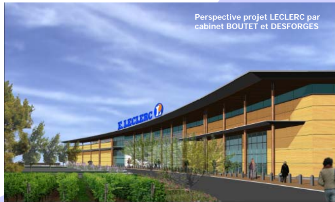
Perspective projet LECLERC par cabinet BOUTET et DESFORGES