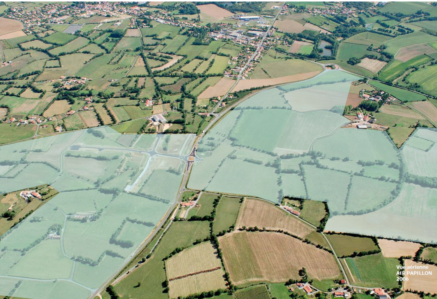
Vue aérienne AIR PAPILLON 2006

Situé à cheval sur les communes de LIRE et du FUILET, le parc d'activités ANJOU ACTIPARC des ALLIÉS est né de la volonté des Communautés de Communes des cantons de MONTREVAULT et de CHAMPTOCEAUX de re-dynamiser leurs territoires.