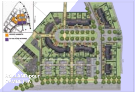
ROLLAND pour GAMBETTA

Le programme de l'opération correspondant au parti d'aménagement arrêté par la commune permettra l'accueil d'environ 650 logements.