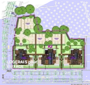
LOGERAIIS pour EIFFAGE