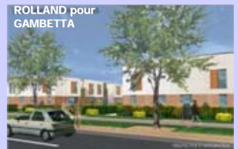
ROLLAND pour GAMBETTA