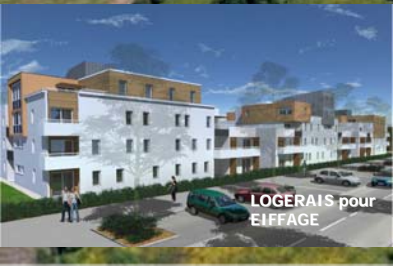
LOGERAIIS pour EIFFAGE

Dans ce souci de développement durable, la ZAC Ardenne favorise les formes d'habitat diversifiées, associant maisons de ville, logements intermédiaires et logements collectifs ainsi que la mixité sociale puisqu'elle comportera plus de 20% de logements locatifs sociaux et près de 15% d'accession sociale.