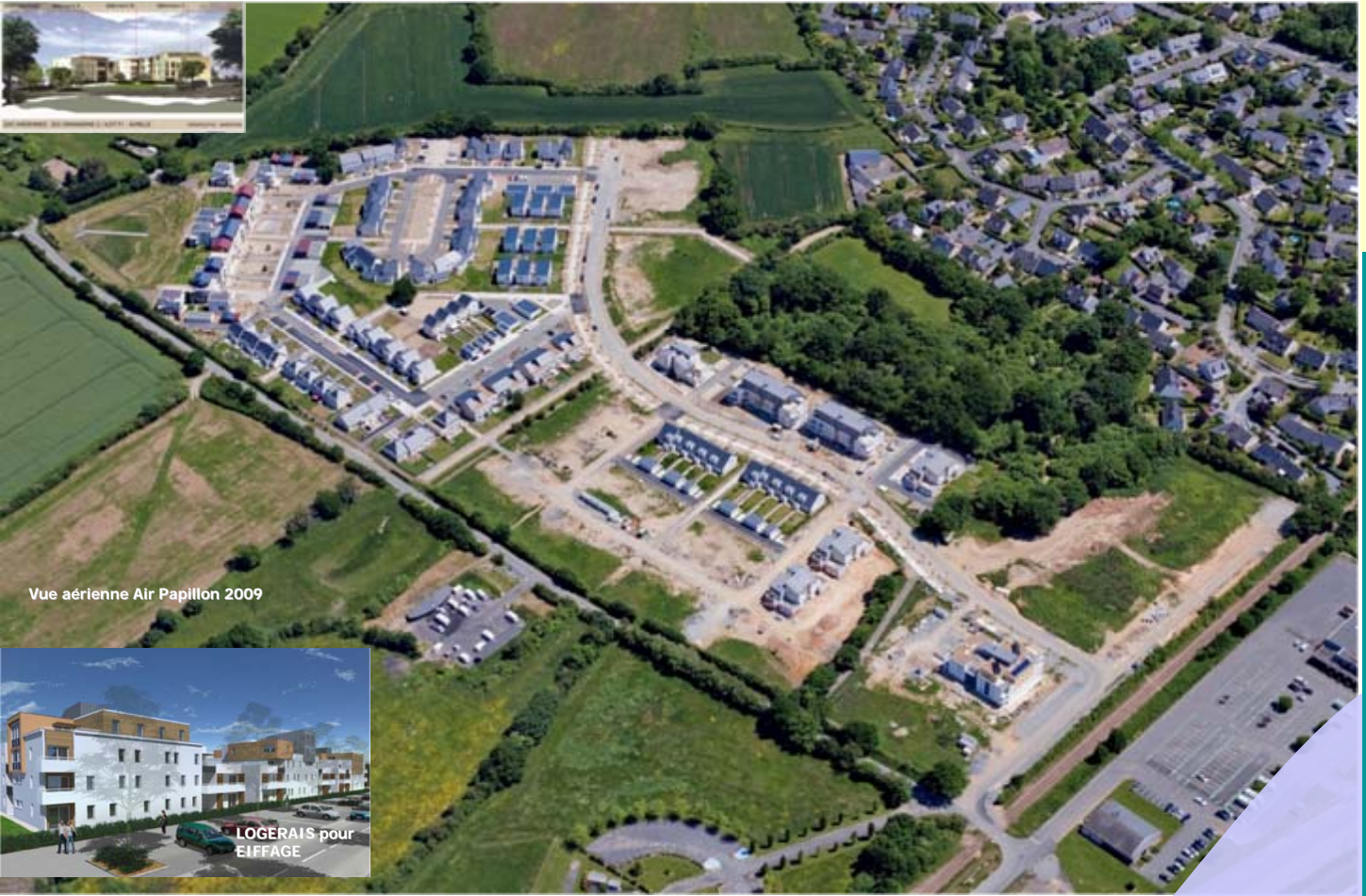
Vue aérienne Air Papillon 2009