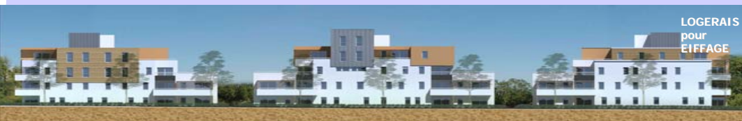
LOGERAIIS pour EIFFAGE