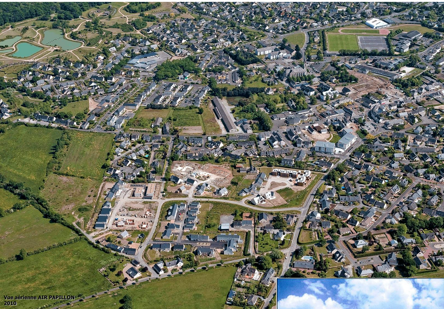
Vue aérienne AIR PAPILLON 2010

Situé au Nord du centre-bourg de SAINT SYLVAIN D'ANJOU, le quartier du Veillerot représente la première partie de l'aménagement d'un secteur plus large : le secteur du Chêne Vert.