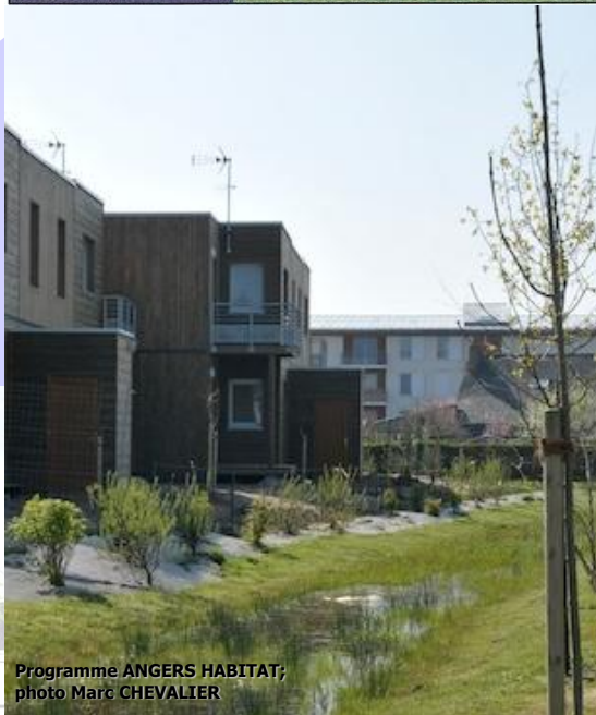
Programme ANGERS HABITAT