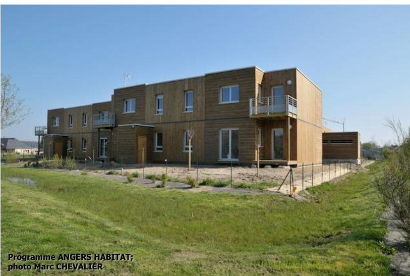
Programme ANGERS HABITAT

Aujourd'hui, le programme d'Angers Habitat, situé square du Potager, compte parmi l'un des derniers secteurs en construction sur le quartier du Veillerot. Ainsi, à terme, une centaine de logements seront construits.