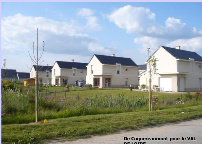
De Coquereaumont pour le VAL DE LOIRE