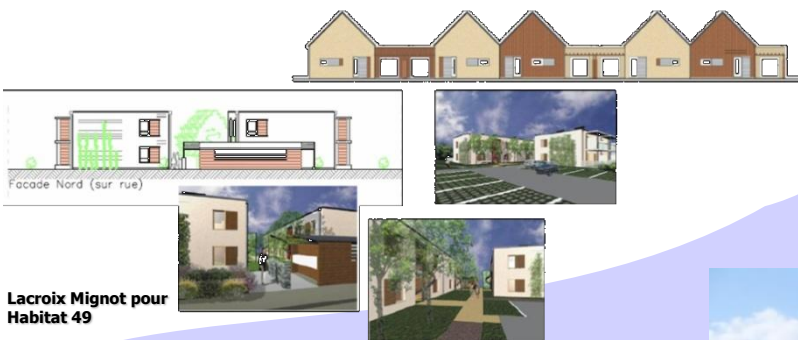
Lacroix Mignot pour Habitat 49