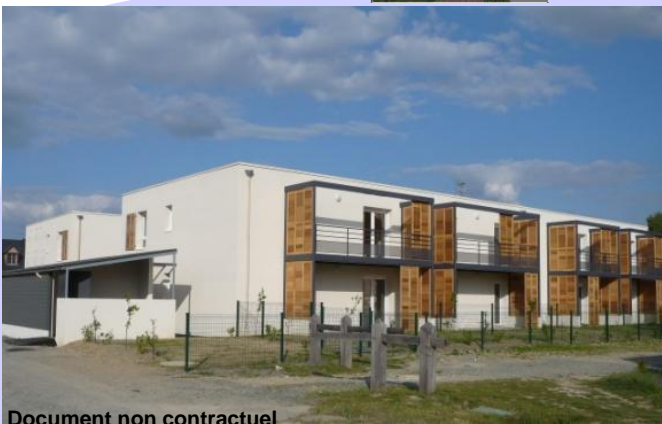
Document non contractuel