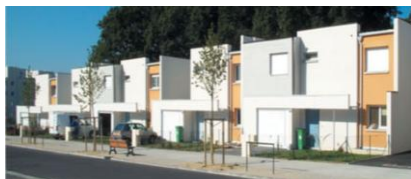
Exemples de maisons de villes

Le parti d'aménagement se caractérise par une organisation en quatre îlots bâtis distincts, reliés par le parc, cœur de quartier, transition paysagère douce avec des secteurs urbanisés.