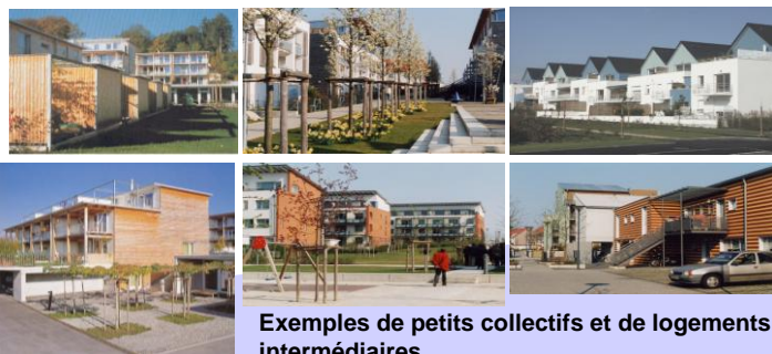
Exemples de petits collectifs et de logements intermédiaires

Une réflexion est mise en place sous la forme de comités consultatifs pour d'une part formaliser les choix et les localisations des différents programmes et d'autre part optimiser l'accroche et la lisibilité du quartier à l'échelle du secteur.