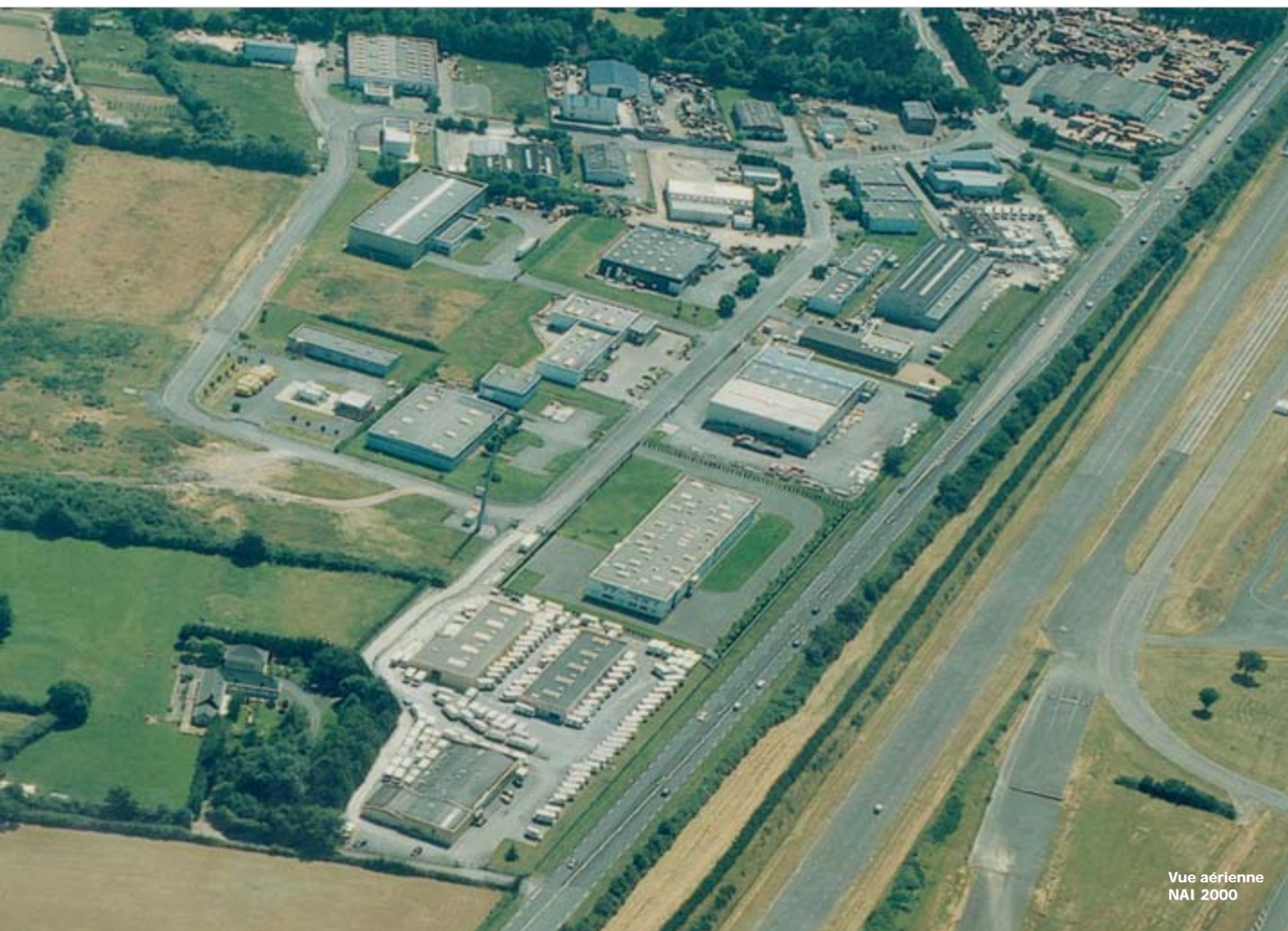
Vue aérienne NAI 2000