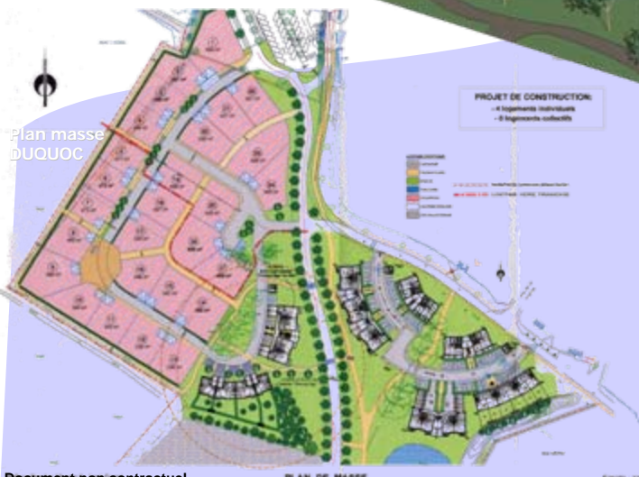
Plan masse DUQUOC

Enfin, afin de garantir l'homogénéité architecturale et paysagère de ce nouveau quartier d'habitation, la SODEMEL s'est associée à l'architecte du lotissement pour assister chaque acquéreur dans leur projet de construction.