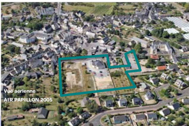
Vue aérienne AIR PAPILLON 2005

Par ailleurs, l'aménagement du quartier prend en compte l'environnement urbain. Ainsi, l'utilisation des matériaux rappelant la typologie locale et l'édification de volumes variés en alignement des voies, assurent une continuité architecturale avec entre le centre bourg.